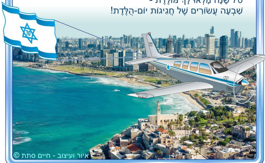
איור ועיצוב - חיים סתת ©

חג למולדת ישראל - חג למדינה, שטוב לחיות בה ולטייל. 70 שנה מלאו לך מולדת - שבועה עשורים של חגיגות יום-הולדת!